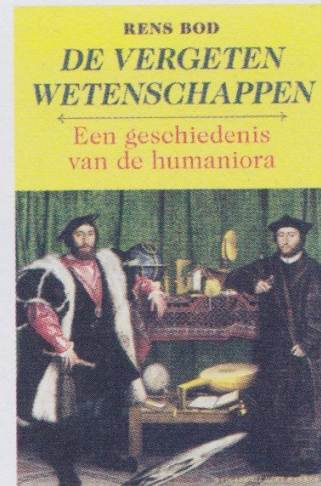
9 Bod 2010