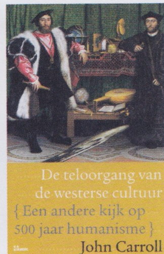
8 Carroll 2006