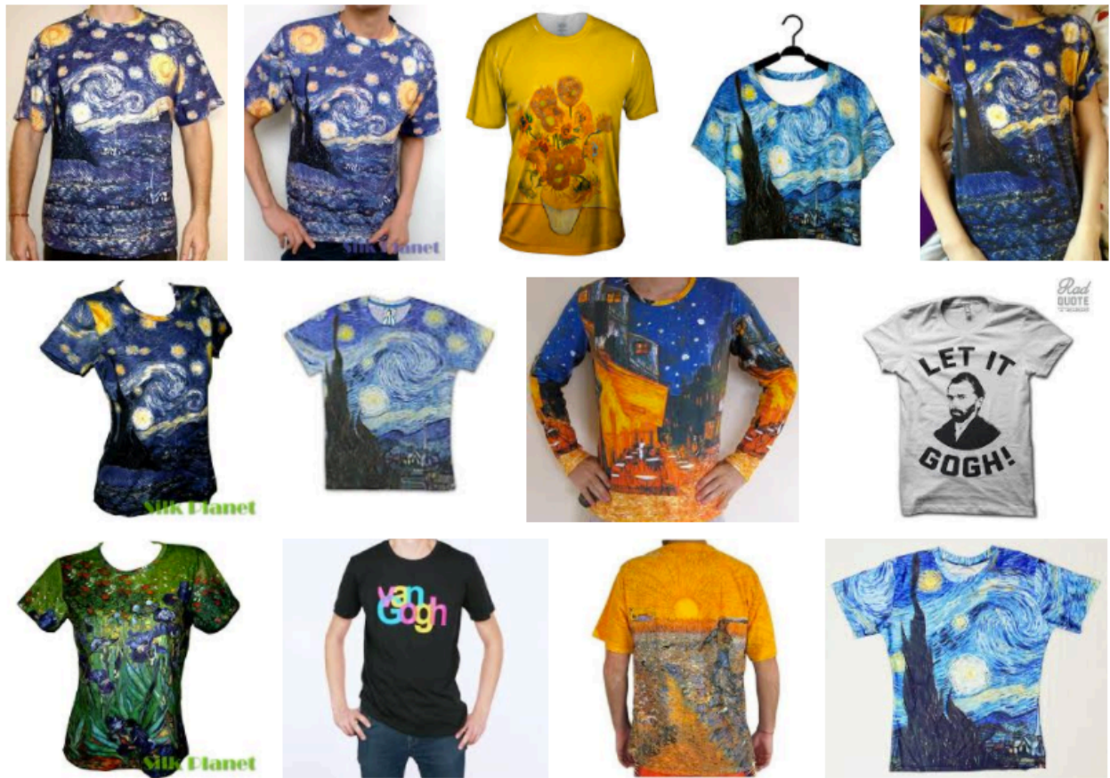
Google afbeeldingen, T-shirts met kunst, in dit geval met Van Gogh.